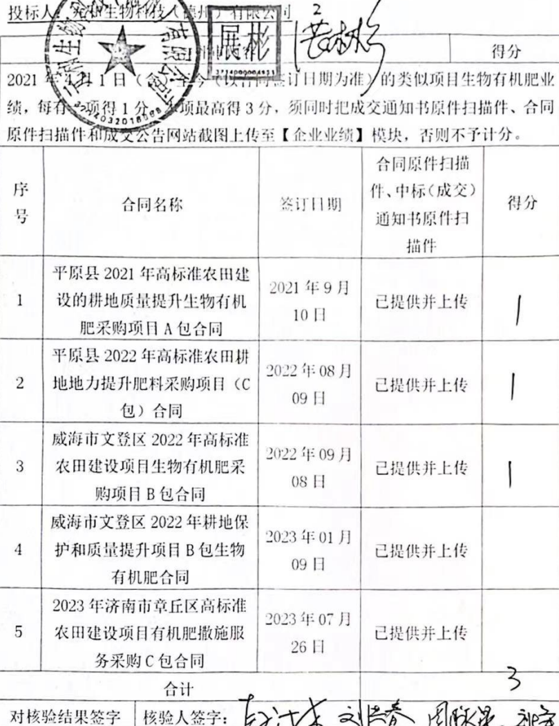
投标人有关业绩、证书统计表

说明: 1、企业填写本表除检验结果一栏外的各个分项, 上传至电子投标其他材料。2、此表根据投标人需要可以扩展。3、此证件统计表仅供投标人参考, 如内容与资格要求或评标办法不一致, 以资格要求及评标办法的规定为准。